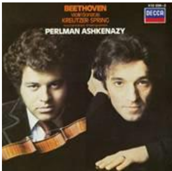
貝多芬第 5 號小提琴奏鳴曲-春，Beethoven : Violin Sonatas，410 554-2 London