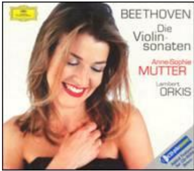
貝多芬小提琴奏鳴曲全集，Beethoven : The Violin Sonatas，457 619-2 DG (4CDs)